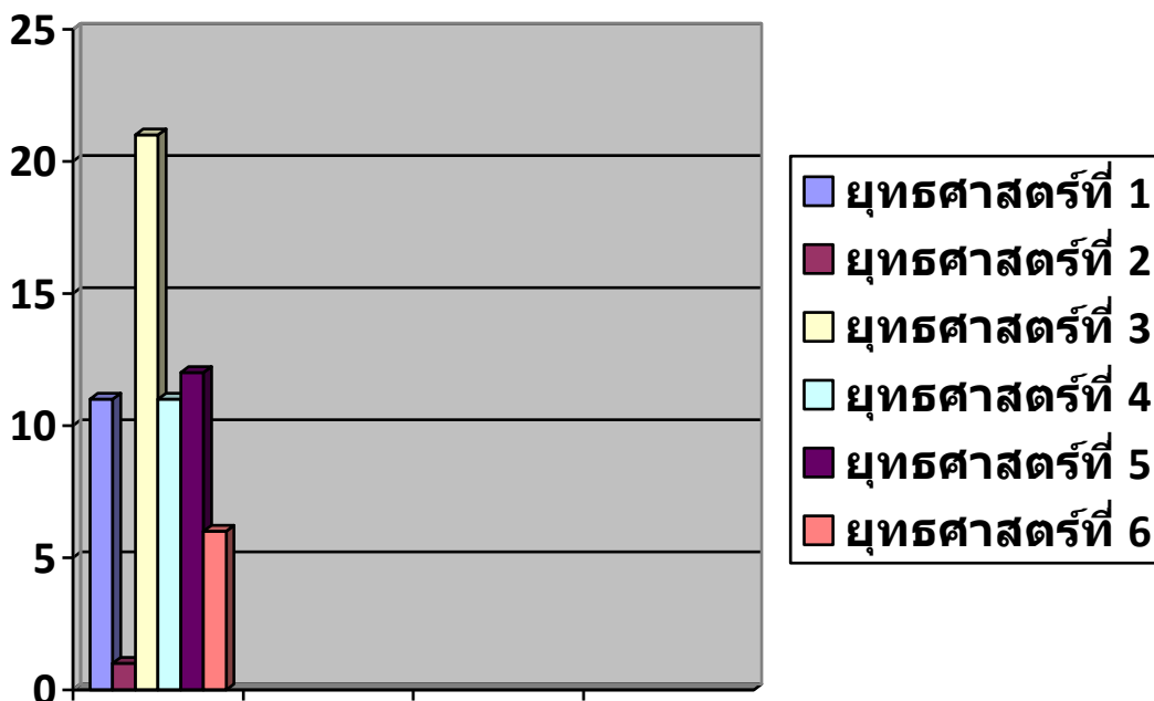
แผนภูมิ แสดงงบประมาณในข้อบัญญัติงบประมาณขององค์การบริหารส่วนตำบลป่าไผ่